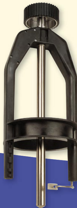
Flyer für Textilmaschinen, Ersatz der bisherigen Lösung in Stahl

Das Ergebnis ist ein perfektes Produkt mit neuen Produkteigenschaftsdimensionen und die Gewährleistung von Prozesssicherheit und niedrigen Produktionskosten.