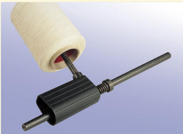
Spulenhalter Kundenspezifische Lösung soll einen einfachen Spulenwechsel ermöglichen Einrasten des Gelenkes in verschiedenen Stellungen Herstellung der Kunststoffteile sowie Montage inhouse