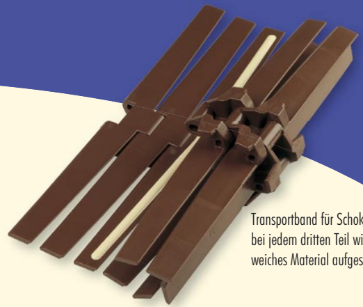
Transportband für Schokolade; bei jedem dritten Teil wird ein weiches Material aufgespritzt

Unsere Möglichkeiten im Mehrkomponenten Spritzguss erlauben die Verbindung von Kunststoffen unterschiedlicher Eigenschaften und Farben in einem Herstellungsprozess. Es entfallen nachträgliche Montagearbeiten.