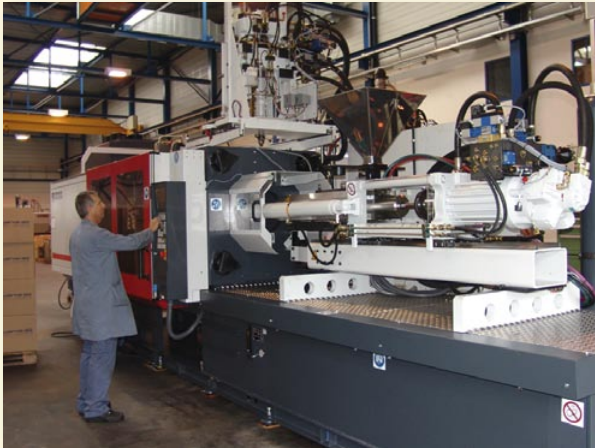
Aus unserem Maschinenpark: modernste Mehrkomponentenspritzgusstechnik 2K, 3 K