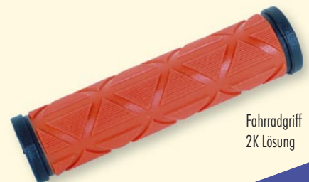
Fahrradgriff 2K Lösung