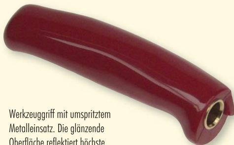
Werkzeuggriff mit umspritztem Metalleinsatz. Die glänzende Oberfläche reflektiert höchste Qualität.

Für effiziente innovative Problemlösungen sind wir ihr Ansprechpartner.