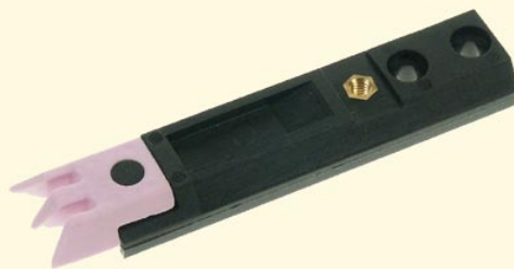
Teil enthält komplexe verspritzte Materialien, wie Keramik und Duroplaste sowie Metalleinlage